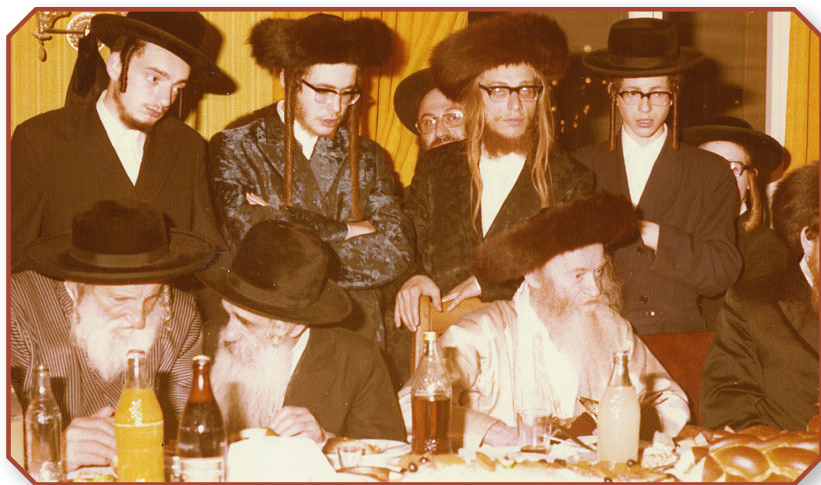
כ"ק מרן אדמו"ר שליט"א ווערט געזען שטיין הונטער'ן זיידן רבינו זצ"ל