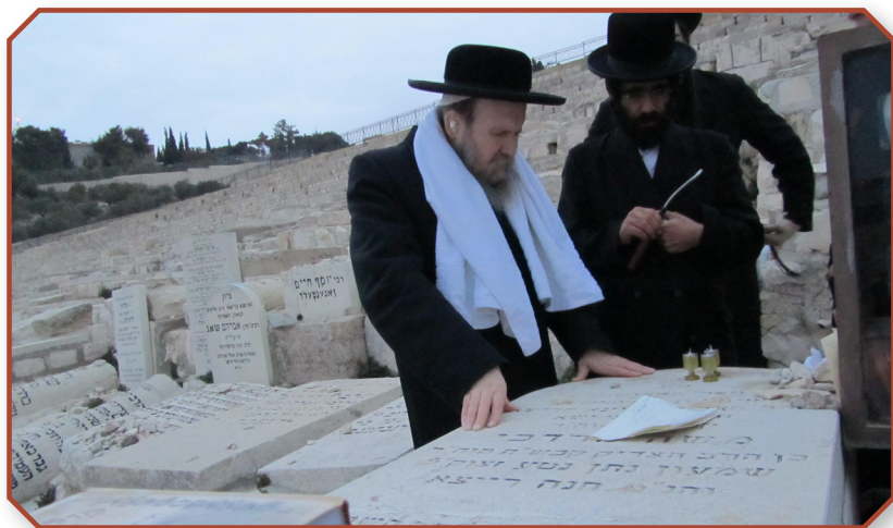
כ"ק מרן אדמו"ר שליט"א מתפלל על ציון קדשו פון מרן רבינו זצ"ל