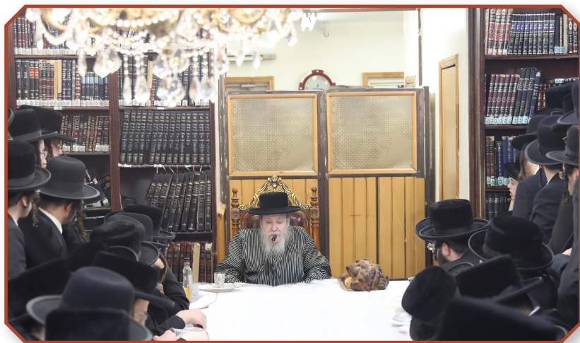
כ"ק מרן אדמו"ר שליט"א ביים עריכת השולחן ביומא דהילולא קדישא פון מרן רבינו זצ"ל