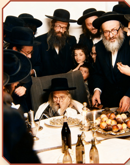
רבינו זצ"ל ביי אן עריכת השולחן אויף די עלטערע יארן. ווערט געזען בנו האדמו"ר מלעלוב ניקלשבורג שליט"א,