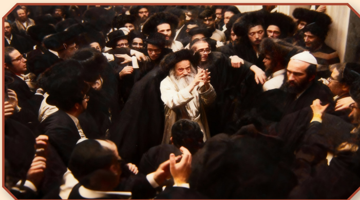
רבינו זצ"ל ביי די עבודת הקודש, ריקודין קדישין בשמחת בית השואבה

אין די אפוענזשהייט פון בנו הרה"ק ר' שמעון נתן נטע זצ"ל, איז דאס הויז פון רבין אין ירושלים נישט געווען פארזיכערט, מענטשן האבן זיך געלאזט צו די ירושה און זיך ערלויבט צו נעמען פון די טייערע חפצי קודש פון פריערדיגע צדיקים וקדושים וואס זענען געלעגן אין רבינ'ס רשות. צום באדויערן האט זיך ארויסגעשטעלט אז ס'איז גארנישט געבליבן פאר דער יורש און מ"מ, הרה"ק ר' שמעון זצ"ל, וואס האט זיך דאן געפונען אין קראקא. ווען בנו, רבינו, איז א צייט שפעטער געקומען