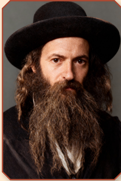
רבינו זצ"ל אין די אינגערע יארן