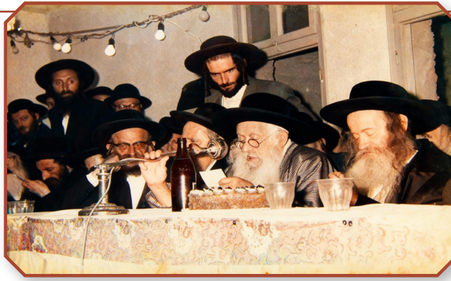
רבינו זצ"ל ביים חנוכת הבית פון ישיבה קארלין-לעלוב

באוויון נפלאות אין תחום פון קירוב נפשות. וואוינענדיג די ערשטע יארן אין תל אביב, איז זיין בית המדרש געווען אן אבן שואבת פאר פילע לאקאלע דערווייטערטע אידן וואס האבן געהאט ביי אים אן אפענע טיר און אפענע הארץ, און מיט זיין השפעה נתקרב געווארן צו שמירת