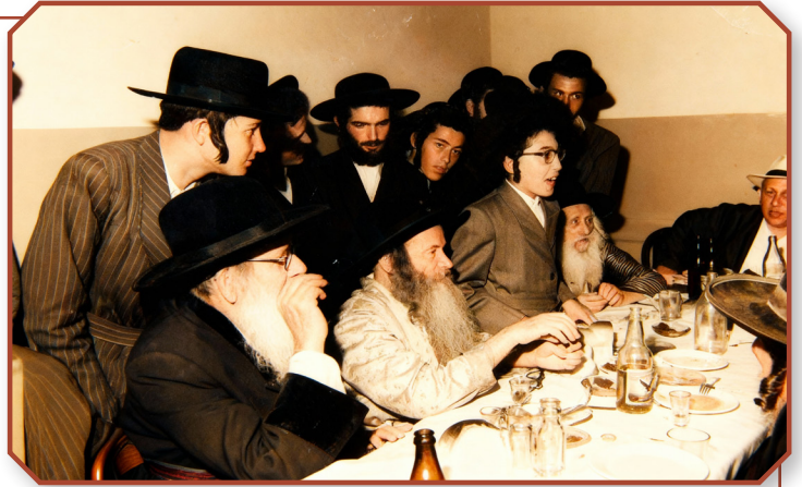
רבינו זצ"ל איז זיך משתתף ביי א שמחה

רבינו איז דאן אלט געווען אינגאנצן זיבן און צוואנציג יאר, און טראץ די שטארקע הפצרות פון לעלבער חסידים האט ער זיך אנטזאגט פון נעמען אויף זיך