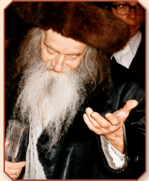
רבינו זצ"ל ביים חתונה פון בנו האדמו"ר מהרי"ד שליט"א