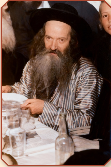
רבינו זצ"ל אין די מיטעלע יארן