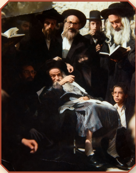
רבינו זצ"ל ביים כותל המערבי אויף די עלטערע יארן, ווערט אויך געזען בנו כ"ק מרן רבינו ר' אלתר אלעזר מנחם זצ"ל